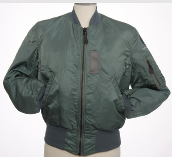
MA-1 Vintage V1 made in USA